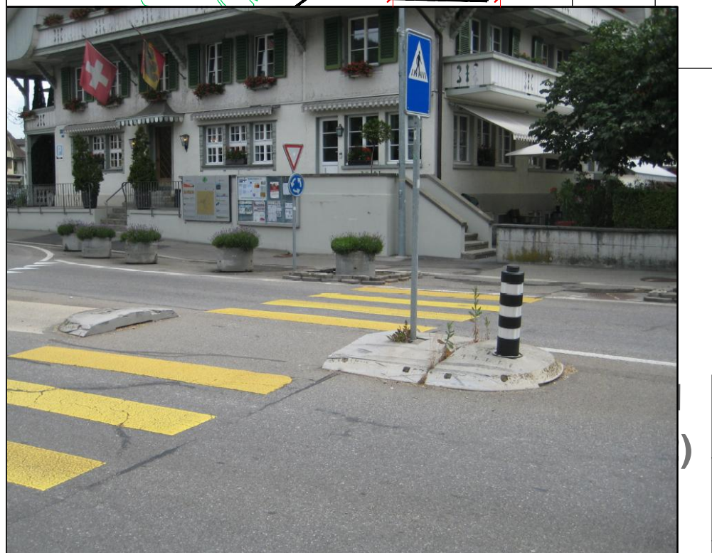
Beispiel prov. Fussgängerinsel mit Fussgängersignal

Genehmigung: Projektleiter: MP Gezeichnet: NT © 2020 Neubau-Projekt und Verbindungsmasse bei Migros Konolfingen, CAD-Plan/Provisorischer Fussgängerstreifen